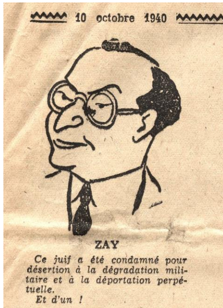
Caricature diffusée dans le journal Gringoire le 10 octobre 1940

« On l'a tout de même eu, ton fumier de mari, ce youtre, symbole vivant de l'ordure d'un régime qui de 1919 à 1939 a conduit notre pays à la guerre, à la défaite et à la ruine ».