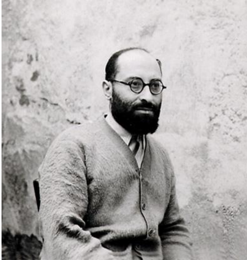
Jean Zay à la prison de Riom

« ... Il faut un effort pour estimer encore en soi l'homme complet , avec tous ses moyens endormis. Il faut à chaque instant faire jouer sa pensée, comme on fait jouer ses muscles, pour se sentir intact, riche de sève et de volonté. Alors le souvenir des jours passés, la certitude de la liberté intérieure, l'espérance de la délivrance peut-être proche et des activités retrouvées surnagent soudain comme la planche de salut. Et vous êtes sauvé. »