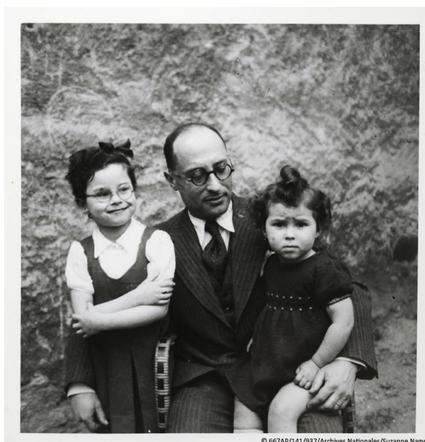
Jean Zay et ses deux filles dans la cour de sa cellule à Riom