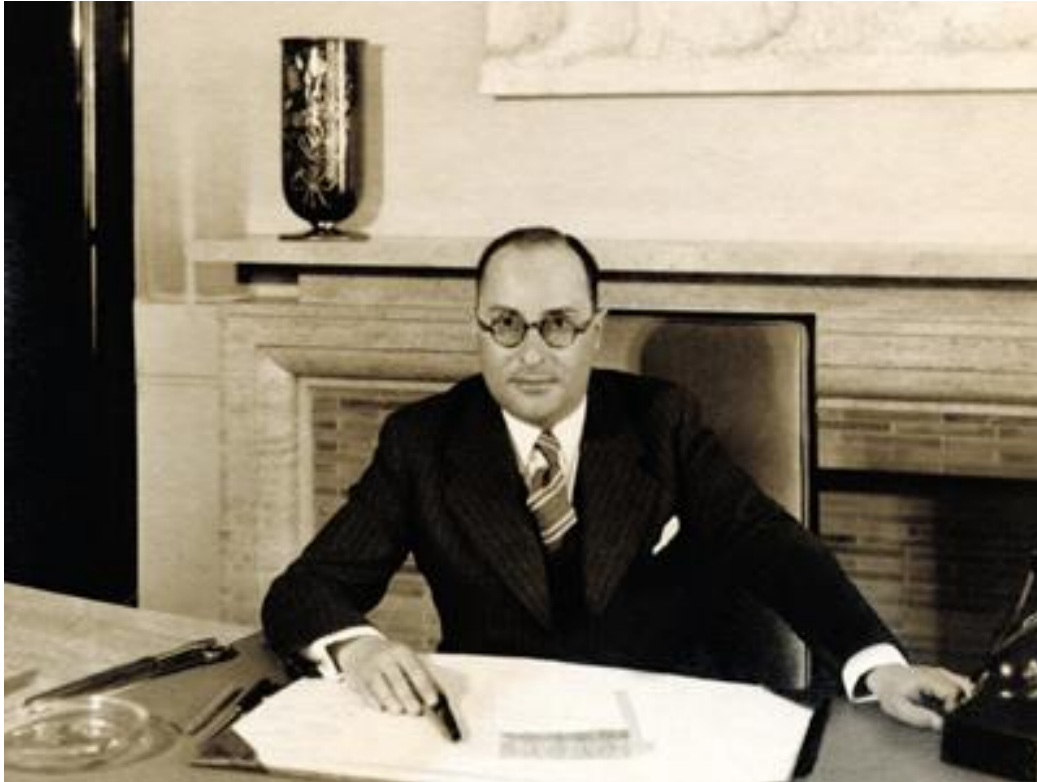
Jean Zay à son bureau du ministère de l'Éducation Nationale

Extrait du texte « Souvenirs et solitude » – 17 janvier 1941